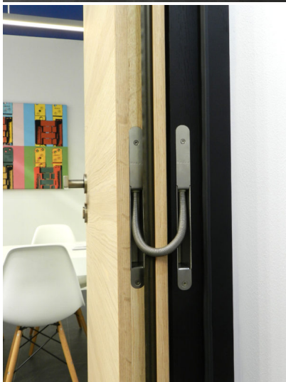
Bildtext: Der Kabelübergang „Pivota Connect“ verschwindet in einer falzseitigen Fräsung und sichert die Energieversorgung zwischen Zarge und Türflügel – Voraussetzung, um die Tür mit zusätzlichen Sicherheits- und Komfortmerkmalen auszustatten.