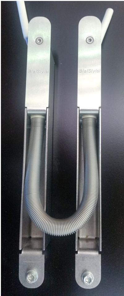
Bildtext: Der Kabelübergang „Pivota Connect“ verschwindet in einer falzseitigen Fräsung und sichert die Energieversorgung zwischen Zarge und Türflügel – Voraussetzung, um die Tür mit zusätzlichen Sicherheits- und Komfortmerkmalen auszustatten.