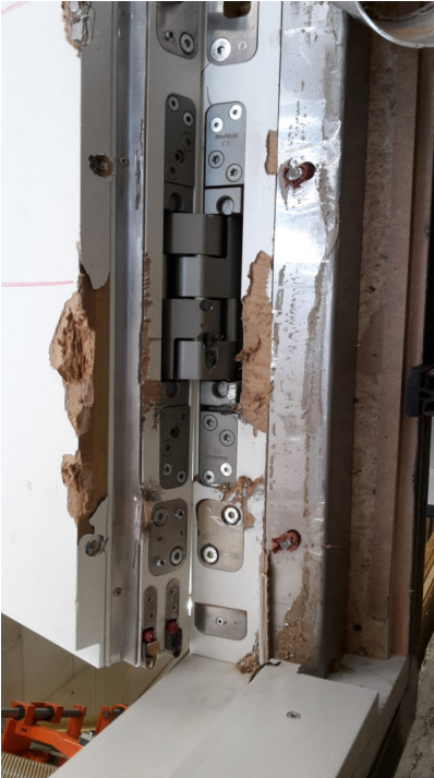
Bildtext 1: Das „Pivota DXS 300 Steel“ weist eine Tragfähigkeit von 350 Kilogramm pro Paar auf und besteht ausschließlich aus Stahl. Dadurch erreicht das Band die Einbruchhemmung der Widerstandsklasse RC4. Das Bild zeigt das Band nach bestandener Einbruchprüfung.