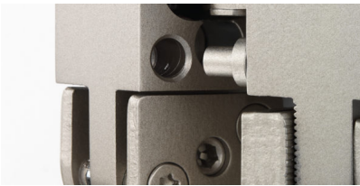
Bildtext 2: Die in das verdeckt liegende Band „Pivota DXS 300 Steel Safe“ integrierte Bandseitensicherung verhindert, dass sich der Türflügel horizontal oder vertikal verschieben lässt. Dabei greift ein gehärteter Stahlstift auf der Zargenseite in eine Bohrung mit Kragen auf der Gegenseite.