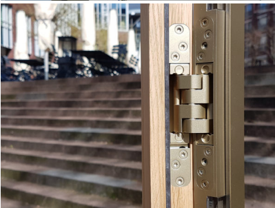
Bildtext 5: Herzstück der „PIVOTA“-Bandserie von Basys ist das patentierte Konstruktionsprinzip. Ein symmetrisches Vier-Arm-Gelenk leitet die Kräfte des Türflügels gleichmäßig in die Zarge. Das Prinzip verleiht den Türen eine leichtgängige Mechanik. Es nimmt die Flügelgewichte zuverlässig auf und sorgt in Verbindung mit dem verwendeten massiven Material für eine hohe Stabilität.