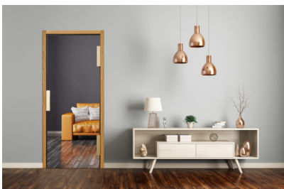
Bildtext 1: Mit dem „PIVOTA DX Glass“ darf die verborgene Bandtechnik nun auch bei Glastüren ihre Vorteile ausspielen.

Herzstück der Bandserie ist das patentierte Konstruktionsprinzip. Ein symmetrisches Vier-Arm-Gelenk leitet die Kräfte des Türflügels gleichmäßig in die Zarge. Es ist mit Kolben, die das Gelenk transversal lagern, mit den Bandkörpern verbunden. Sie lenken die auftretenden Kräfte beim Öffnen und Schließen kreisförmig in alle Richtungen. Dieses Prinzip verleiht den Türen eine leichtgängige Mechanik. Es nimmt die Flügelgewichte zuverlässig auf und sorgt in Verbindung mit dem verwendeten massiven Material – selbst bei extremen Gewichten und häufiger Nutzung – für eine hohe Stabilität.