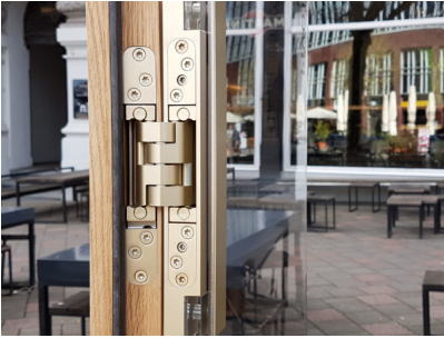
Bildtext 3: Glastüren, die mit dem „PIVOTA DX Glass“ ausgestattet sind, lassen sich bis 180 Grad öffnen, sind wartungsfrei gelagert und dreidimensional justierbar.