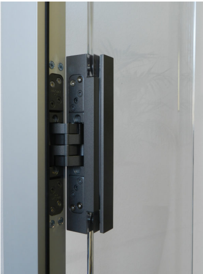
Bildtext 4: Der Kasten, der das Flügelteil des „PIVOTA DX Glass“ aufnimmt, ist aus massivem Alu und bietet Oberflächenvielfalt, so dass sich das Design an den Zierbeschlag anpassen lässt.