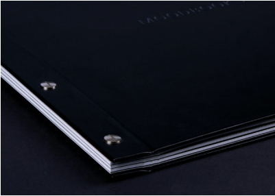
Didascalia 5a: Schwinn presenta la versione aggiornata del Suo "Moodbook 2020".