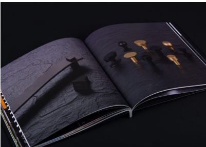
Didascalia 5b: Il "Moodbook 2020" non solo mette in risalto le novità, ma testimonia anche un attento esame del design.