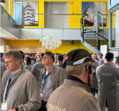
Bildtext 2: Rund 100 Gäste aus den Mitgliedsunternehmen des FVHF informierten sich beim Spezialisten für architektonische HPL-Außenanwendungen über den neusten Stand der Entwicklung eines in vielerlei Hinsicht zukunftssträchtigen Fassadenmaterials.