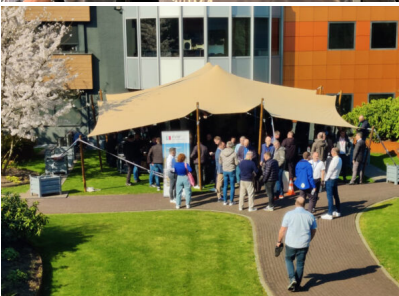
Bildtext 3: Am 19. März 2026 hat der Fachverband Baustoffe und Bauteile für vorgehängte hinterlüftete Fassaden e.V. – FVHF im Rahmen des jährlichen Netzwerktreffens die Trespa International B.V. in der niederländischen Provinz Limburg besucht.