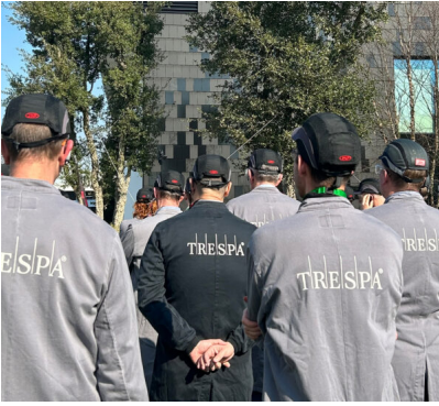
Bildtext 1: Am 19. März 2026 besuchte der Fachverband Baustoffe und Bauteile für vorgehängte hinterlüftete Fassaden e.V. – FVHF im Rahmen des jährlichen Netzwerktreffens die Trespa International B.V. in der niederländischen Provinz Limburg.