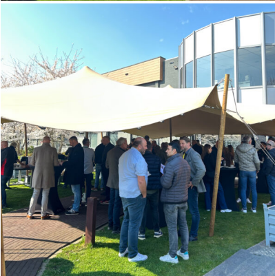
Bildtext 4: Am 19. März 2026 hat der Fachverband Baustoffe und Bauteile für vorgehängte hinterlüftete Fassaden e.V. – FVHF im Rahmen des jährlichen Netzwerktreffens die Trespa International B.V. in der niederländischen Provinz Limburg besucht.