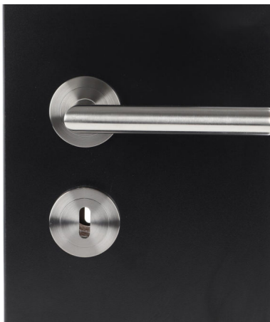
Bildtext 1: Die dünne Schraub-Rosette, ein nahezu fugenloses Erscheinungsbild und die geschliffene Oberfläche machen die DTS-Rosettengarnituren der Seefelder-Eigenmarke „sLINE“ zu zeitlosen Klassikern.

Für eine hohe Widerstandsfähigkeit in der Anwendung sorgen die stabile Metall-Unterkonstruktion und die fest-drehbare Lagerung der Rosettengarnituren. Eine gutachterliche Stellungnahme des ift Rosenheim bescheinigt geprüfte Qualität. Jede „sLINE“-DTS-Rosettengarnitur entspricht generell der Gebrauchsklasse 3; mit einem speziellen Zubehörset lassen sich die Drückergarnituren für die Gebrauchsklasse 4 aufrüsten.