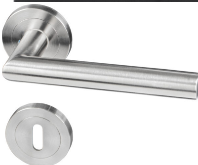
Bildtext 2a: Highlight der „sLINE“-DTS-Kollektion bildet die puristische und geradlinige „Linie 50“, die die klassische Drückergarnitur in Gehrungsform modern interpretiert und neben Edelstahl gebürstet auch in trendigem Schwarz erhältlich ist.