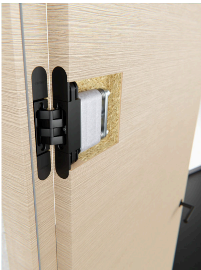
Bildtext 1: Mit dem verdeckt liegenden Band „Pivota DXS Close“ schließen Türen sanft und selbsttätig. Version 2.0 ist mit einem Stahlgelenk und einer damit verbundenen Schließmechanik ausgestattet, die wie das Band in der Türfräsung verschwindet. Im Gegensatz zur Ursprungsversion präsentiert sich das „Pivota DXS Close 2.0“ etwas kompakter, woraus lediglich eine größere Ausfräsung im Türblatt resultiert.

Basys löst mit dem Update vor allem Probleme, die mit der zugekauften Gaszugfeder in Verbindung standen. Die neue Konstruktion entsteht direkt im Werk des Beschlagherstellers in Kalletal. Sie ist auf langlebige und wartungsfreie Funktion mit konstant zuverlässiger Zug- und Schließkraft ausgelegt. Zudem sorgt das „Pivota DXS Close“ dafür, dass sich die Tür ohne Widerstand leichtgängig öffnen lässt.