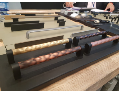
Bildtext 1: Werkstattatmosphäre kam auf an dem rustikalen Massivholz-tisch im Zentrum des Schwinn-Messestandes zur SICAM. Hier fanden sich Freigabemuster, Ideen und Prototypen, die von Kundenseite aus eine Feinjustierung erlauben. Beste Gelegenheit, sich inspirieren zu lassen und gemeinsam exklusive Lösungen zu erarbeiten.