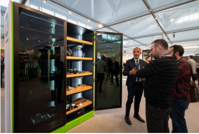
Bildtext 3: Der auf 750er Schrankbreite angepasste Hochschrankbeschlagn „CONVOY Lavido“ kam gut bei den Besuchern der SICAM an. Kesseböhmer zeigte edle Ausstattungsvarianten mit Holztablaren, schwarzen Glasrahmenfronten und beleuchtetem Innenraum.