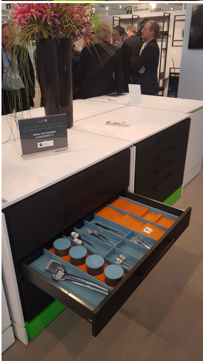
Bildtext 6: Attraktive Präsentation: Mit dem nachhaltigen Material „OrganiQ“ gehört das Holzwerk Rockenhausen zu den 35 Finalisten des Deutschen Nachhaltigkeitspreises Design 2023.