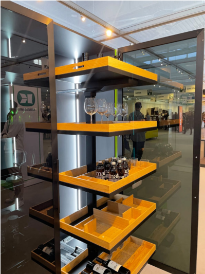
Bildtext 3: Der auf 750er Schrankbreite angepasste Hochschrankbeschlagn „CONVOY Lavido“ kam gut bei den Besuchern der SICAM an. Kesseböhmer zeigte edle Ausstattungsvarianten mit Holztablaren, schwarzen Glasrahmenfronten und beleuchtetem Innenraum.