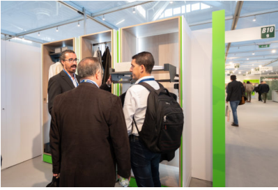
Bildtext 2: Highlight im „Conero“-Programm von Kesseböhmer: Kleiderlift mit zusätzlicher Ablagefläche.