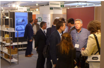
Bildtext 4: Der an die Interzum angelehnte, neu gestaltete Messestand von Kesseböhmer war zur Sicam im Oktober 2017 in Pordenone durchweg gut frequentiert; die besondere Atmosphäre der als Kontaktmesse bekannten Plattform bot gute Möglichkeiten für intensive Gespräche.