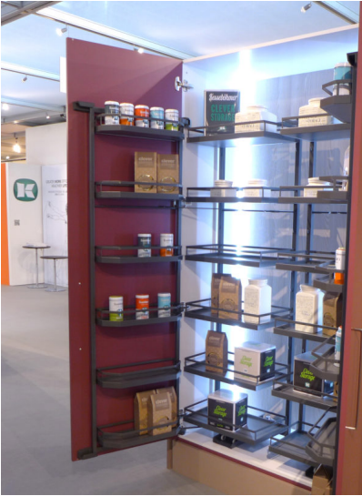
Bildtext 13: Mit dem neuen Türregal "Tandem side" stellte Kesseböhmer auf der Sicam im Oktober 2017 eine Möglichkeit vor, Stauraum in die Tür zu verlagern - hier in der Kombination mit dem klassischen "Tandem"-Beschlag im "Tandem depot".