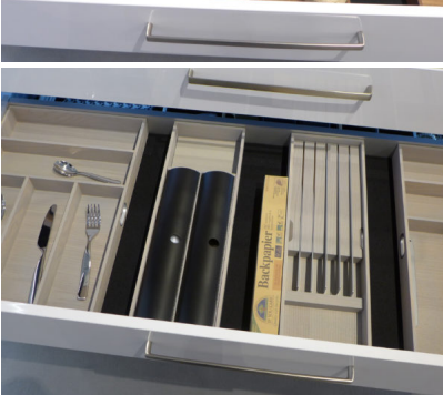
Bildtext 7: Die gezeigten Stauraumideen aus dem Holzwerk Rockenhausen in edlen Holz-Metall-Kombinationen, aus denen sich maßgeschneiderte Kundenprogramme herleiten lassen, sind bei den internationalen Besuchern auf der Sicam im Oktober 2017 in Pordenone gut angekommen.