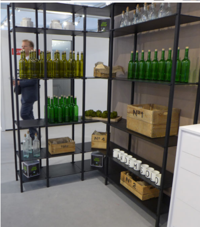
Bildtext 11: Das Thema offener Stauraum rund um „tRack“ wurde auf der Sicam in Pordenone mit internationalen und insbesondere italienischen Kunden nachhaltig und gezielt diskutiert.