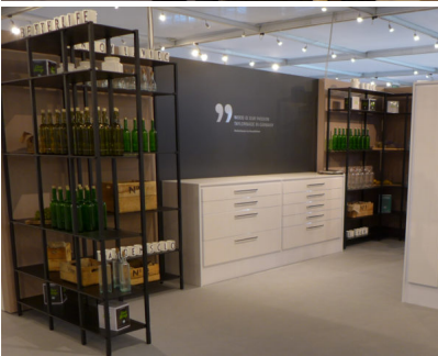
Bildtext 5: Unter dem Motto „Wood is our passion – tailor-made in Germany“ gab Kesseböhmer zur Sicam im Oktober 2017 einen Ausblick, mit welchem Anspruch die Unternehmensgruppe das Holzwerk Rockenhausen zukünftig weiterentwickeln will.