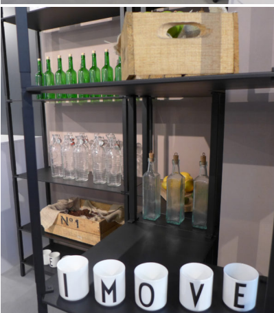
Bildtext 12: Das Thema offener Stauraum rund um „tRack“ wurde auf der Sicam in Pordenone mit internationalen und insbesondere italienischen Kunden nachhaltig und gezielt diskutiert.