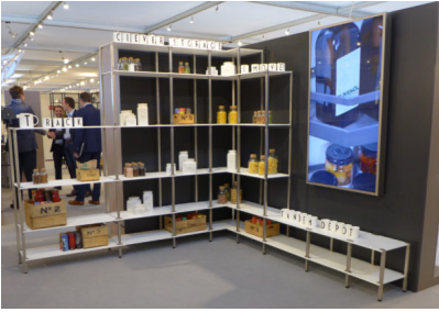
Bildtext 9: Das Thema offener Stauraum rund um „tRack“ wurde auf der Sicam in Pordenone mit internationalen und insbesondere italienischen Kunden nachhaltig und gezielt diskutiert.