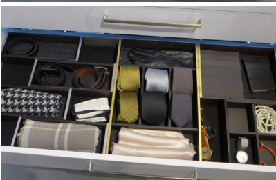
Bildtext 8: Die gezeigten Stauraumideen aus dem Holzwerk Rockenhausen in edlen Holz-Metall-Kombinationen, aus denen sich maßgeschneiderte Kundenprogramme herleiten lassen, sind bei den internationalen Besuchern auf der Sicam im Oktober 2017 in Pordenone gut angekommen.