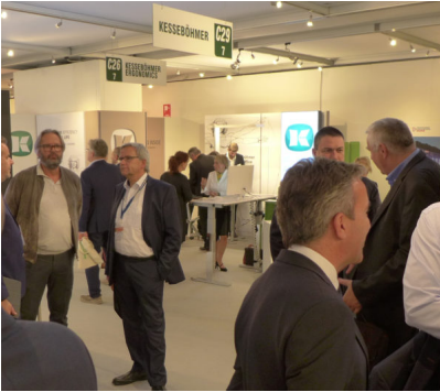
Bildtext 3: Der an die Interzum angelehnte, neu gestaltete Messestand von Kesseböhmer war zur Sicam im Oktober 2017 in Pordenone durchweg gut frequentiert; die besondere Atmosphäre der als Kontaktmesse bekannten Plattform bot gute Möglichkeiten für intensive Gespräche.