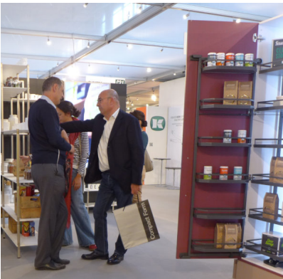
Bildtext 14: Mit dem neuen Türregal "Tandem side" stellte Kesseböhmer auf der Sicam im Oktober 2017 eine Möglichkeit vor, Stauraum in die Tür zu verlagern - hier in der Kombination mit dem klassischen "Tandem"-Beschlag im "Tandem depot".