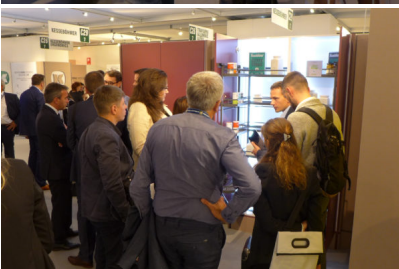
Bildtext 2: Der an die Interzum angelehnte, neu gestaltete Messestand von Kesseböhmer war zur Sicam im Oktober 2017 in Pordenone durchweg gut frequentiert; die besondere Atmosphäre der als Kontaktmesse bekannten Plattform bot gute Möglichkeiten für intensive Gespräche.