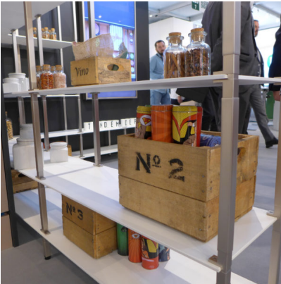
Bildtext 10: Das Thema offener Stauraum rund um „tRack“ wurde auf der Sicam in Pordenone mit internationalen und insbesondere italienischen Kunden nachhaltig und gezielt diskutiert.