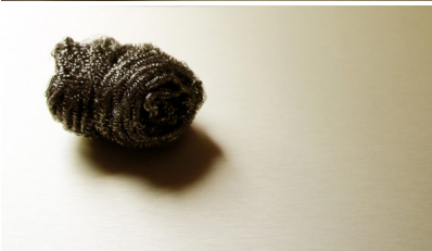
Bildtext 3: „SRM“ präsentiert sich als in hohem Maße kratzunempfindliche Oberfläche mit regelmäßigen und damit widerstandsfähigen Strukturen in Highend-Qualität.