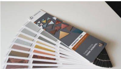
Bildtext 4: Für Planer und Architekten entwickelte Homapal spezielle Marketingmaterialien, die zum vielseitigen Einsatz der neuen „SRM“-Oberfläche inspirieren. Dazu gehört beispielsweise ein Musterfächer.