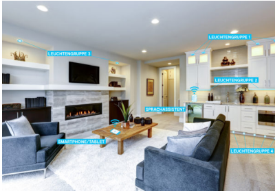
Bildtext 2: Die „L&S Emotion“-Technologie erlaubt es, mehrere Leuchtengruppen über eine Smart Home-Anbindung mit dem Smartphone/Tablet oder per Sprachassistent zu steuern und so die Beleuchtung jederzeit an den individuellen Bedarf anzupassen.