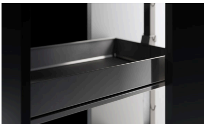
Bildtext 1: Bei „Arena pure“ ist der Name Programm. Puristisch und ausdrucksstark passt das Auszug-Tablar zu einer geradlinig modernen und zugleich wohnlich gestalteten Inneneinrichtung und dem Trend zu einem minimalistischen Zargendesign. Hier im Einsatz beim Apothekerauszug „Dispensa“.

Die schlanke, mit einer schmalen umlaufenden Nut akzentuierte Metallumrandung des geschlossenen „ARENA pure“-Tablars ist in Silber und Anthrazit lieferbar. Mit ihrem zeitgemäßen Minimalismus und der zurückgenommenen Eleganz schafft sie die Grundlage, puristisches Design durchgängig und markentypisch in der Schrankinnenausstattung zu etablieren und Küchen eine neue Wertigkeit zu verleihen.