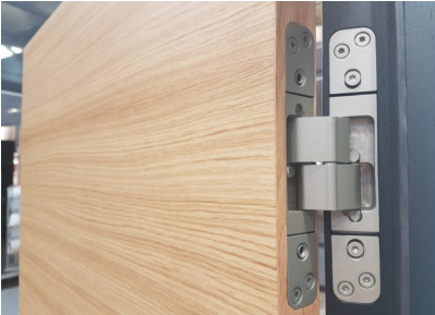
Bildtext 5: Verarbeiter interessierten sich vor allem für das „Pivota DX LT“, ein Einstiegsmodell für 40 Kilogramm schwere Türen.