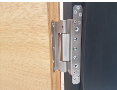
Bildtext 8: Das Rollenband für 350 Kilogramm schwere Objekttüren rundete den Neuheitenkanon, der sich bei Basys durch alle Hauptproduktgruppen zog, ab.