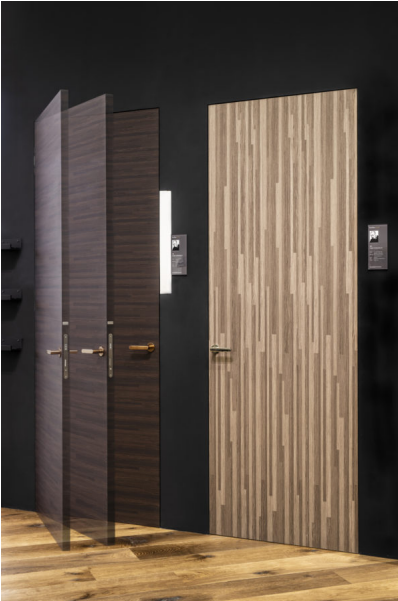
Bildtext 9: Ein Großteil der Türen- und Zargenhersteller zeigte neue, mit Bartels Systembeschlägen umgesetzte Lösungen. Im Bild: Die zur BAU 2019 mit dem Innovationspreis Architektur und Bauwesen ausgezeichnete „Under-Cover-Doorframe von Bod’or KTM bei der das verdeckt liegende Band für stumpf einschlagende Türen „Pivota DX“ von Basys zum Einsatz kommt. Foto: BaSys