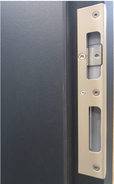
Bildtext 6: Verarbeiter interessierten sich auf der BAU für die Justierfunktion bei den Schließblechen. Diese gibt es durchgängig, und sie bietet aufgrund der Fräskompatibilität innerhalb der Systemgruppen Flexibilität durch schnellen, einfachen Austausch.