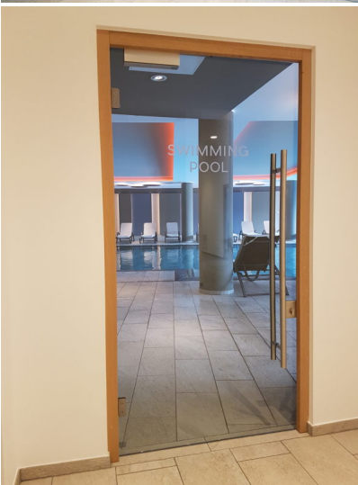
Bildtext 7a: Flexibilität attestiert die Meistertischlerei ihrem Zulieferer BaSys. Das zeigen unter anderem die 30 Bänder an den Ganzglastüren im Schwimmbad und Wellnessbereich des Hotels „Cristal“.