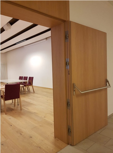
Bildtext 4: Die Spezialtüren für die Konferenzräume wurden mit besonderen Anforderungen an den Schallschutz entwickelt.