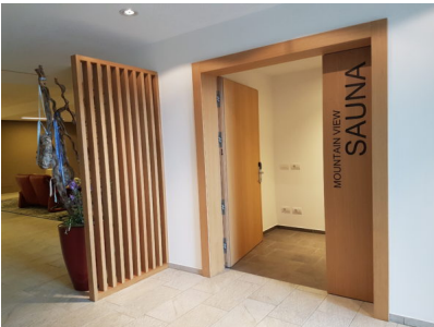
Bildtext 6: An den Türen zu den Konferenzräumen und zur Panoramasauna montierten die Fachleute 15 Mal das „Pivota DX 200“ für 200 Kilogramm schwere Türen.