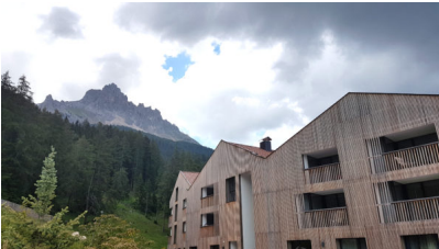
Bildtext 1: 96 Zimmer, das Restaurant, Konferenzräume und ein sechs Saunen umfassender Wellnessbereich – trotz seiner Größe fügt sich das „Cristal“ harmonisch in die Landschaft am Fuße des Latemar-Massivs.