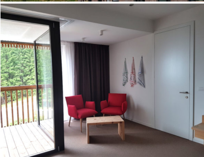
Bildtext 2: Bei den Zwischentüren in den Hotelzimmern schließt das Türblatt flächenbündig mit der Zarge ab. Die Technik bleibt im Verborgenen und die Tür wird in ihrer minimalistisch-puristischen Ausführung Teil der Wand.