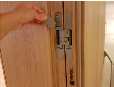
Bildtext 5: Die verdeckt liegenden Bänder finden sich im Hotel „Cristal“ allesamt in der Designausführung; dabei sorgen magnetisch gehaltene Abdeckplatten für eine schraubenlose Optik.