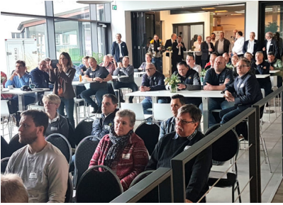
Bildtext 1: Rund 100 Bauelemente-Händler, Tischler und Schreiner kamen zur Auftaktveranstaltung der EGE-Fachhandelstage 2020 nach Verl.