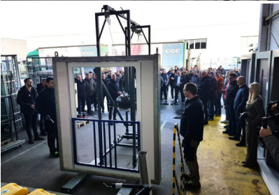
Bildtext 9: Großes Interesse zeigten die Teilnehmer der EGE-Fachhandelstage an den Pendelschlagversuchen zur Absturzsicherung.