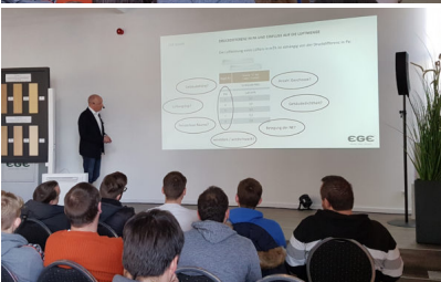
Bildtext 11: In seinem zweiten Vortrag widmete sich EGE-Produktmanager Martin Kampwirth der sachgemäßen Lüftung von mit Kunststofffenstern ausgestatteten Räumen.